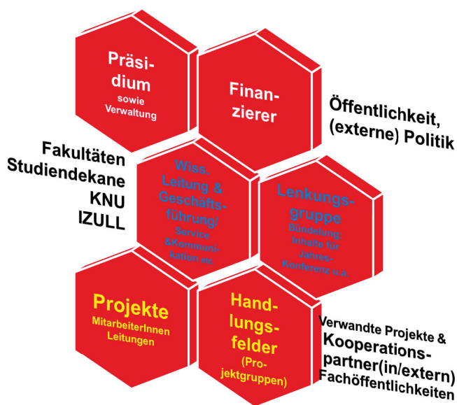
Governance-Struktur des Universitätskollegs Die Entwicklung des Bleibenden implementieren

Auf der Website www.universitaetskollg.de finden Sie die Beschreibung dieser Handlungsfelder und ihrer Inhalte sowie die Namen der jeweiligen Leiterin / des jeweiligen Leiters. Deren Aufgabe ist es insbesondere, darauf hinzuwirken, dass Synergien genutzt, aus Erfahrungen gelernt und die Übertragbarkeit des erarbeiteten Praxiswissens gewährleistet wird. Außerdem treffen sie sich regelmäßig mit der wissenschaftlichen Leitung und der Geschäftsführung des Universitätskollegs, um mit ihnen gemeinsam über anstehende Fragen und sich abzeichnende Entwicklungen und Perspektiven zu beraten. In dieser erweiterten Lenkungsgruppe (LKG) wirkt auch der Vizepräsident für Studium und Lehre mit.